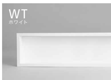
< ※ セラルル FKM6000 ZMN >