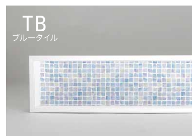
< ※ セラルル FAN1721 ZMN >