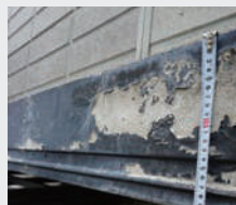
1 既存幕板及び下地確認