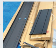
2 本体切断及び隙間調整 (必要に応じて)