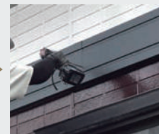
3 幕板カバーの取り付け 納まり図をご確認ください。