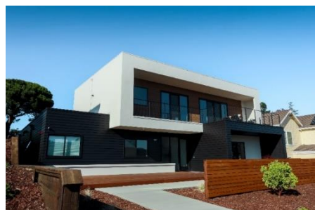
HOMMA ONE 完成現場(外観)

当社は、HOMMA 社がカリフォルニア州に建設したプロトタイプ住宅「HOMMA ONE (ホンマ ワン)」及びオレゴン州に建設予定のプロトタイプコミュニティ「HOMMA X (ホンマ テン)」を通じて米国建売住宅向けの住宅建材のリサーチおよび提案を進めていく予定です。今回 HOMMA 社に対して出資を行うことにより関係を強固なものとし、ウィズコロナ・アフターコロナの「新しい生活様式」にも対応できる、ユニークな住宅建材を米国市場に向け開発して参ります。