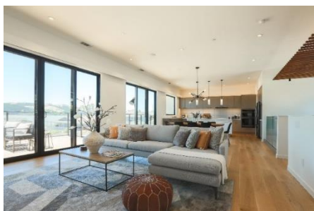
HOMMA ONE 完成現場(内観)